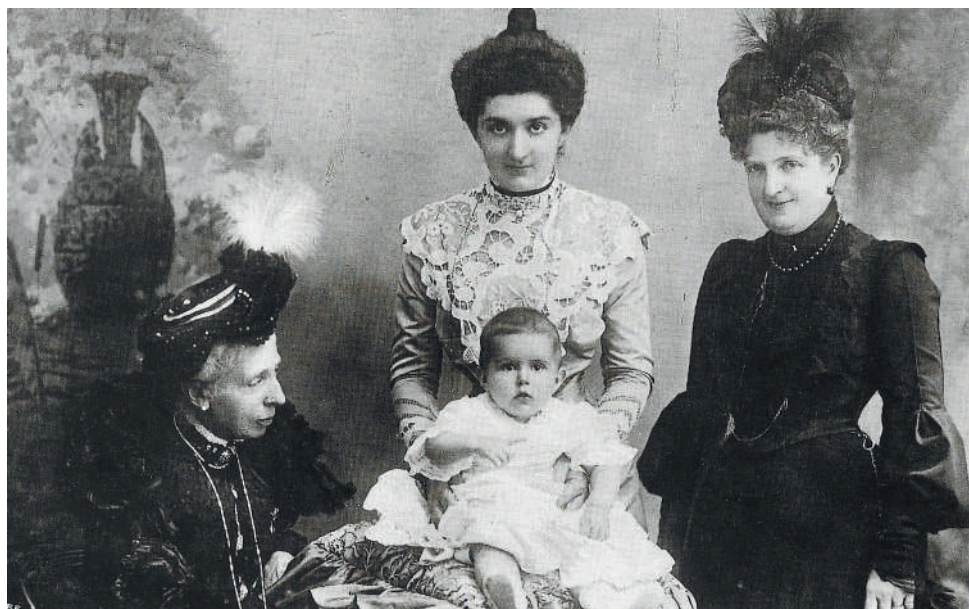
Umberto bambino: dietro di lui la madre Elena di Montenegro, alla sua sinistra la nonna Margherita di Savoia Genova: alla sua destra la bisnonna Elisabetta di Sassonia, 1905