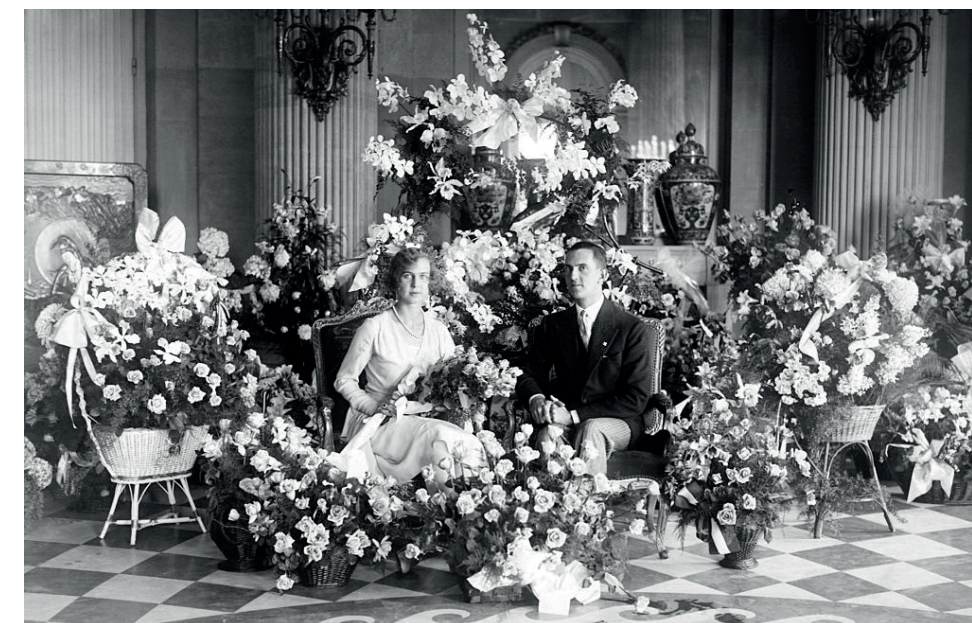
Il principe Umberto di Savoia e la principessa Maria José del Belgio al Palazzo Reale di Laeken a Bruxelles in occasione del fidanzamento nel 1929. cartolina postale.