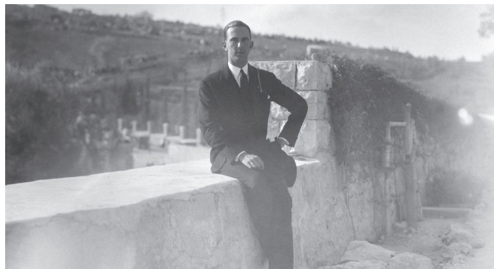
Umberto di Savoia posa, seduto in abiti borghesi su un muretto, con il cappello in mano Roma, Istituto Luce